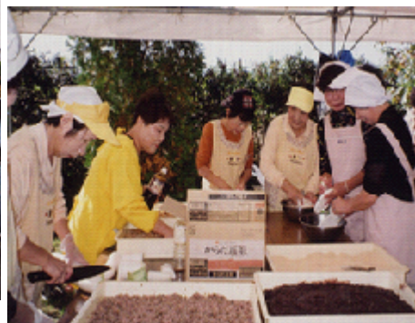
さくら祭り もちのふるまい