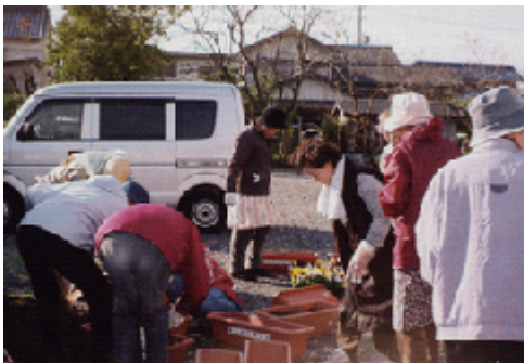
プランターに花の苗を植え各地区に配布