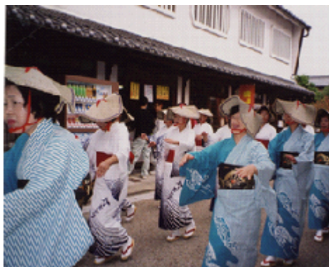
関宿街道祭りに参加