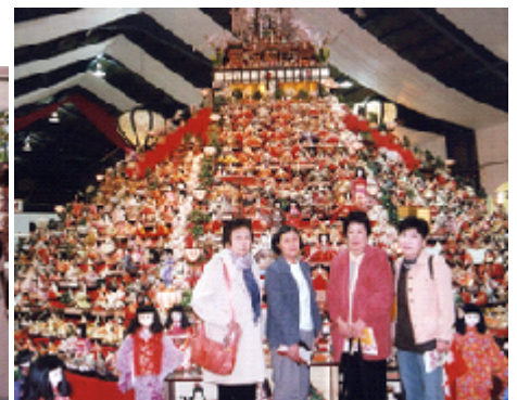
冬期研修旅行「全国変りびな」視察