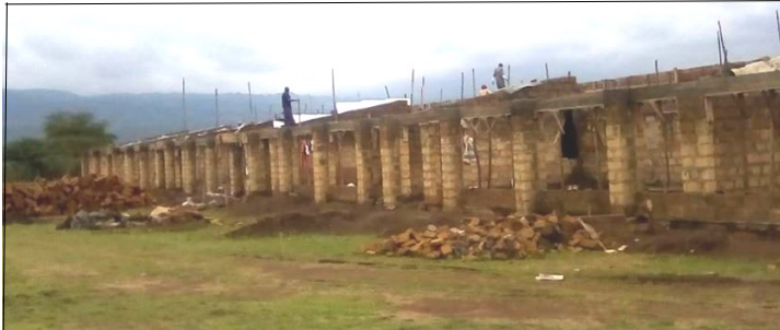
現在建設中の学校校舎