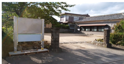
中村公民館に建設中の説明板