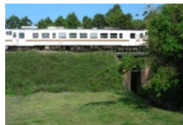
現在の銃撃現場付近

今年度、文化スポーツ課まちなみ文化財グループ及び歴史博物館と協働事業連続講座を実施しますので、ご参加ください。