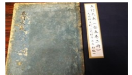
元禄13年(西暦1700年) 「五行大義」 一色時棟(号菊叢) 初版本