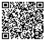
協働事業提案書 QRコード

問合せ：市民文化部 まちづくり協働課 市民協働グループ ☎0595-84-5008