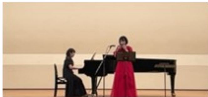
コットンツリーのお二人