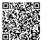
協働事業提案書 QRコード

その他：4月1日から、市民協働グループの窓口が、市民協働センター「みらい」1階に移動します。